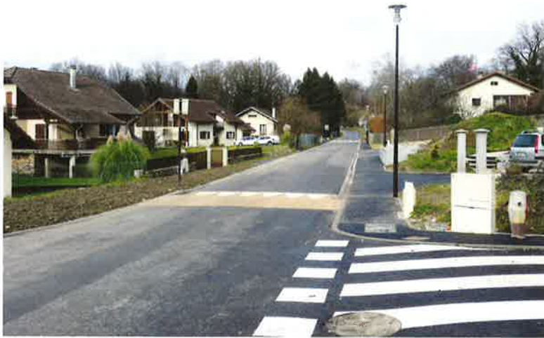
Route des Terrailers avec mise en place de contenaires enterrés