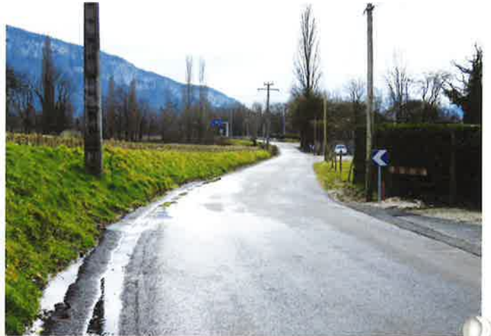
Route des chênes