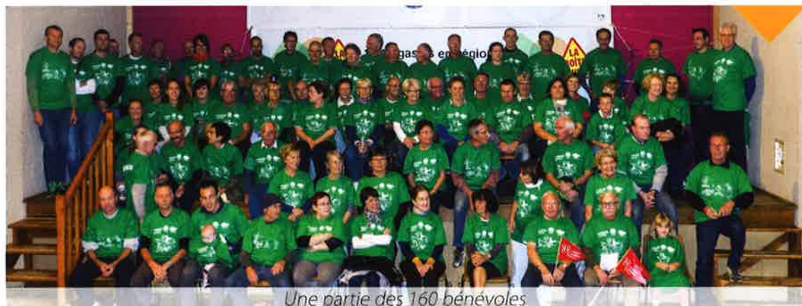
Une partie des 160 bénévoles