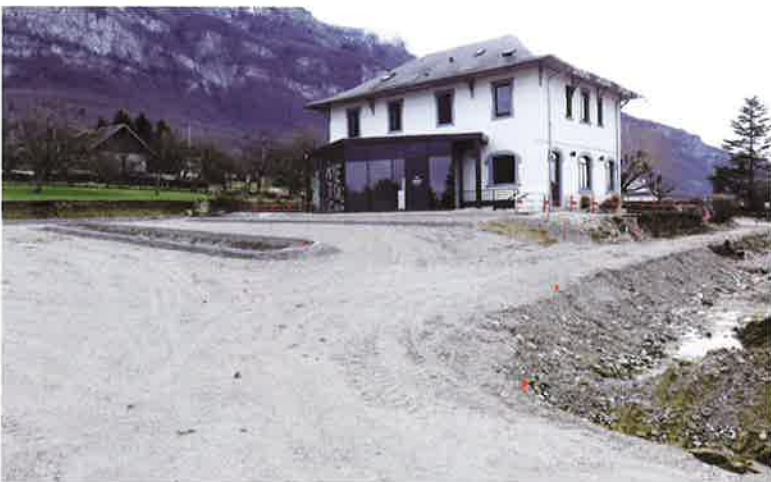
Création de places de parking au nord de la mairie