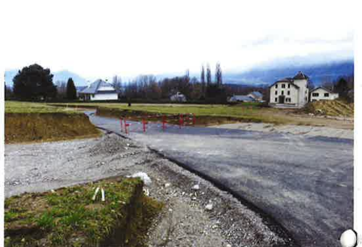
Aménagement du Pré fleuri