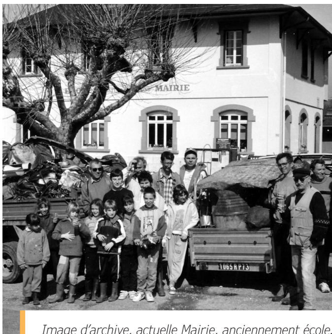
Image d'archive, actuelle Mairie, anciennement école.

Contactez la Mairie au 04.79.63.64.00 ou par mail à mdrumettaz.accueil@orange.fr