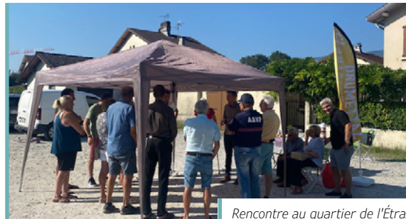
Rencontre au quartier de l'Etraz

Merci aux personnes présentes pour ces moments partagés riches d'échanges. ▲