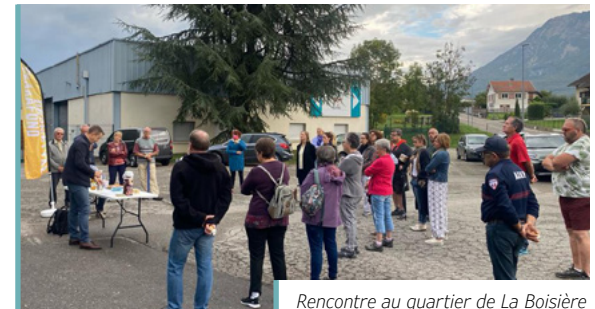
Rencontre au quartier de La Boisière