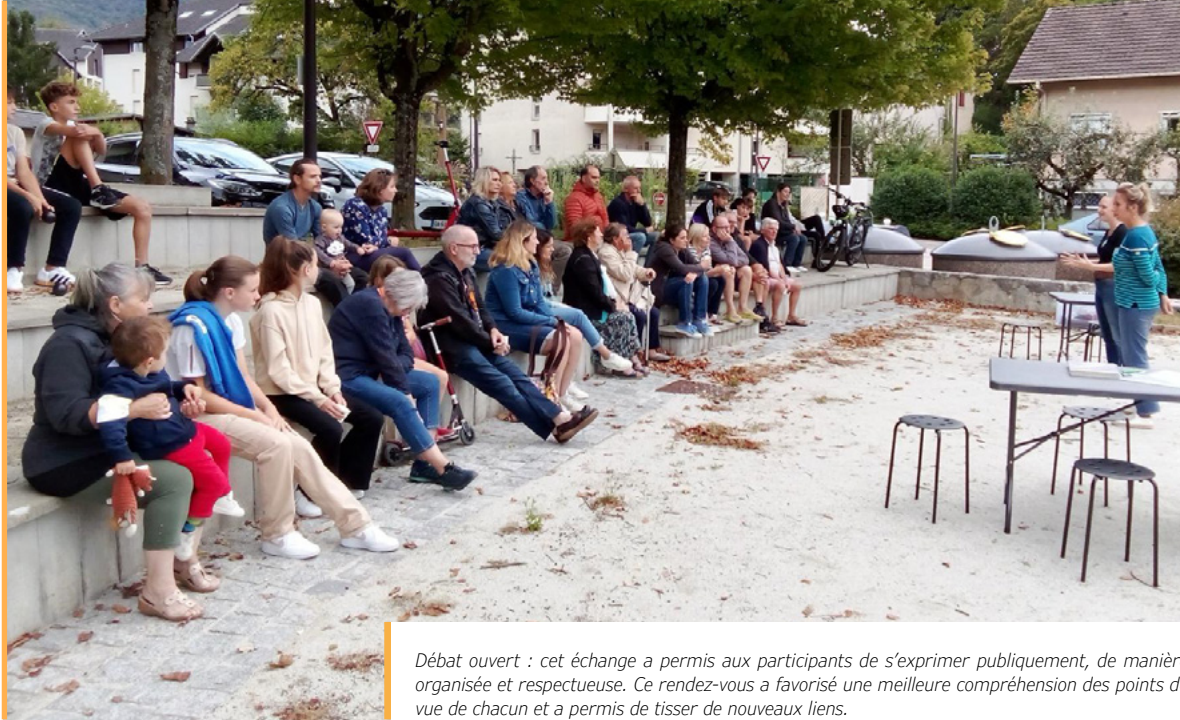
Débat ouvert : cet échange a permis aux participants de s'exprimer publiquement, de manière organisée et respectueuse. Ce rendez-vous a favorisé une meilleure compréhension des points de vue de chacun et a permis de tisser de nouveaux liens.